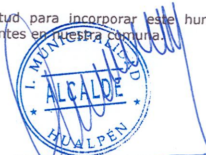
MIGUEL RIVERA MORALES ALCAIDE DE HUALPÉN