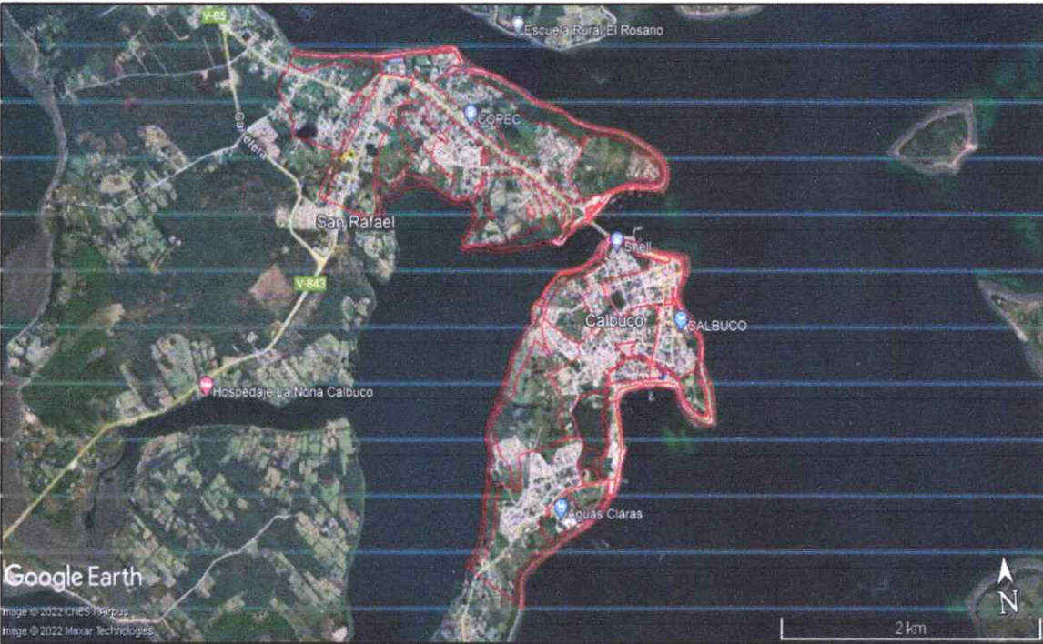
Figura 1. Imagen del Humedal Balcón del Cerro, ubicado en el sector San Rafael, PRC.

Este Humedal, se encuentra en el sector San Rafael, del Plan Regulador Comunal de CALBUCO (en adelante, PRCC) (Gobierno Regional X Región de Los Lagos, 2006).