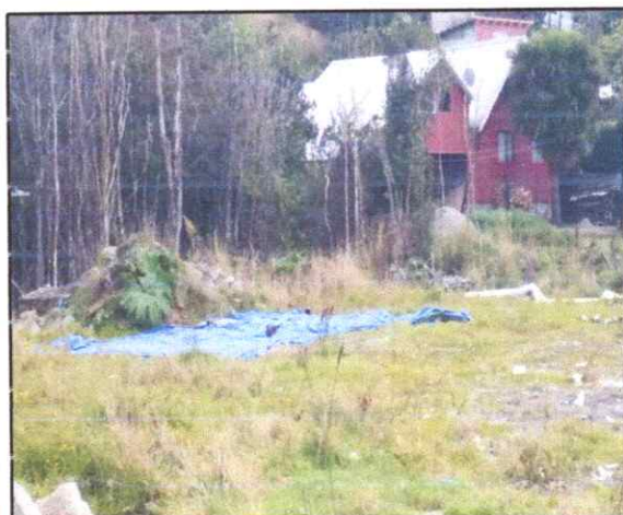
Figura 10. Microvasural, que está afectando a la comunidad de avifauna.