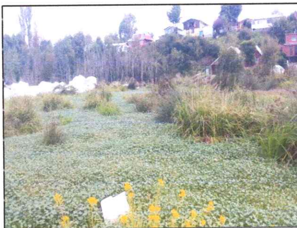
Figura 9. Registro de vertedero o microbasural.

La utilización del predio como Vertedero ilegal y su ocupación para depositar residuos industriales (Figura 10 y Figura 11).