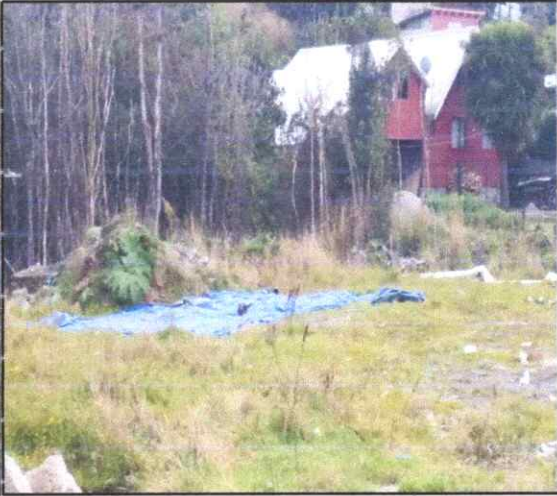
Figura 6. Ejemplares de Vanellus chilensis .

El Humedal a declara se encuentra inmerso en el sector en la población Balco+on del cerro, el cual ha ido en retroceso, en la cobertura vegetal hidrofila, versus aumento a la carga habitacional.