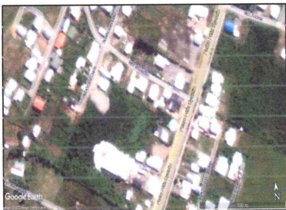
Figura 7. Imagen espejo de agua, abril 2011.