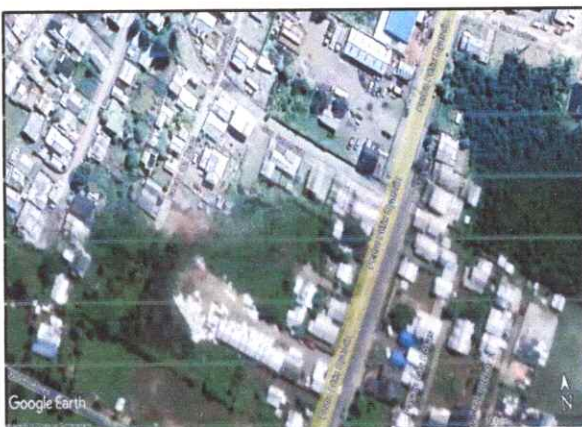
Figura 8. Imagen espejo de agua, abril 2022.