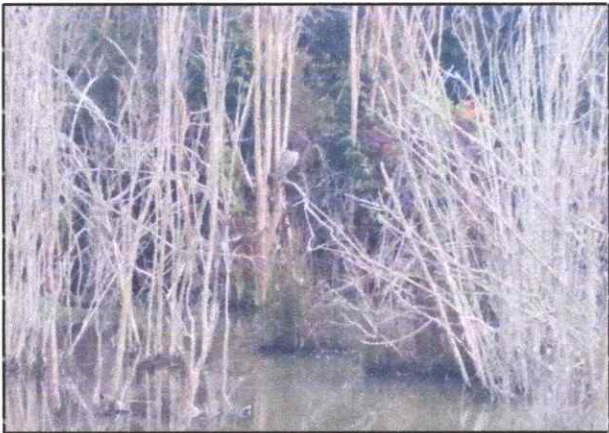
Figura 3 Ejemplar de Nycticorax nycticorax .

NT: Casi Amenazado ; LC: Preocupación menor; VU: Vulnerable