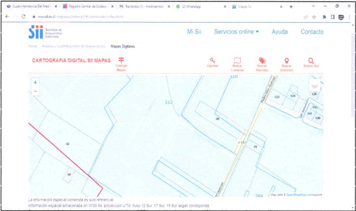
Figura 13. Descripción de predios cercanos al humedal Balcón del cerro (SII, 2022).