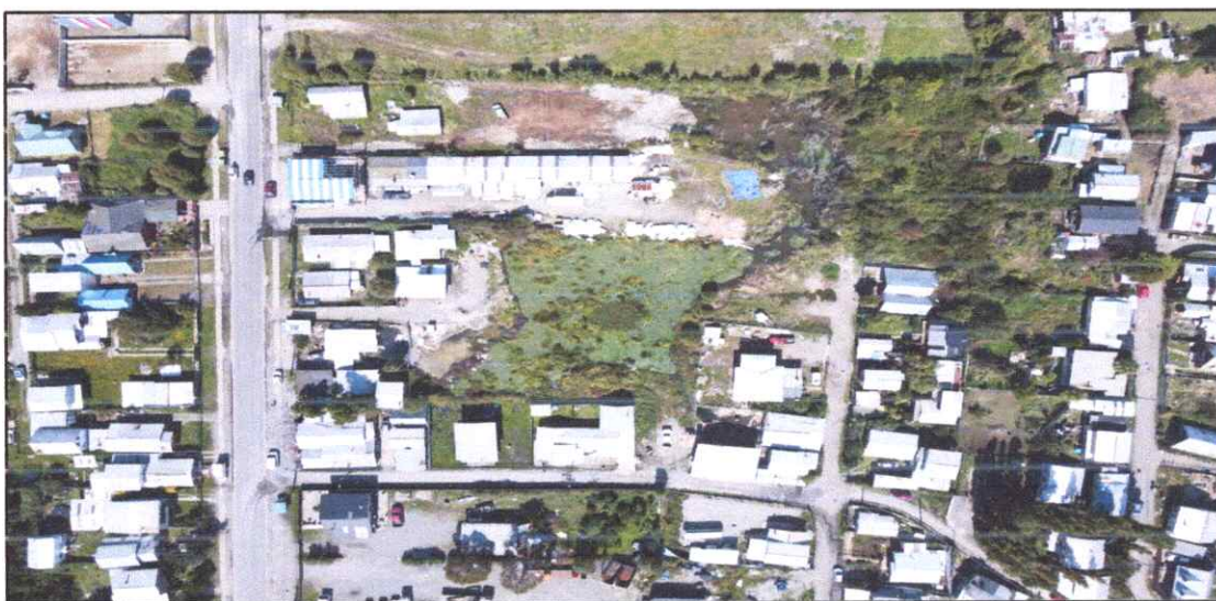
Figura 11. Imagen aérea, mediante Drone "Mavic air 2"

Respecto, al Catastro de Dirección de Obras Municipales (DOM), la identificación del régimen de propiedad del humedal a declarar (Figura 12), se encuentra al interior de la propiedad del Sr Pedro Sanchez Barría, Rol 169-31 (Figura N° 13), correspondiente a la manzana 512 (Figura N°14) (SII, 2022).