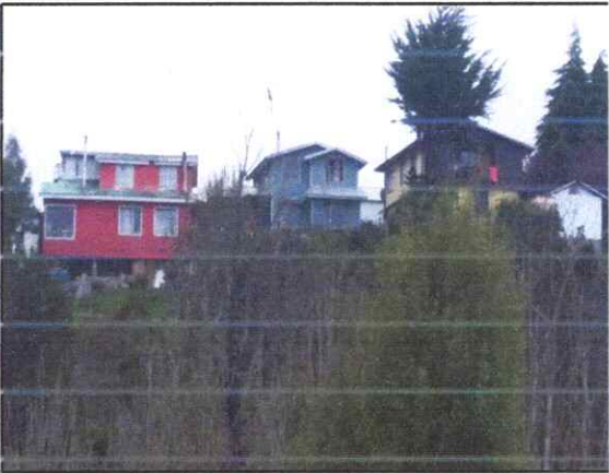
Figura 4. Ejemplar de Phalacrocorax chilango .