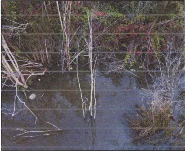
Figura 5. Ejemplares Anas platyrhynchos .