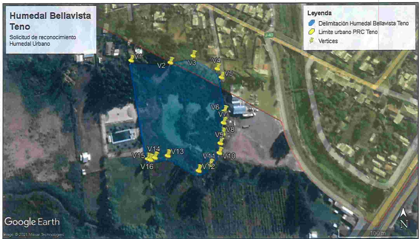
Tabla 1. Listado referencial de vértices y coordenadas geográficas del archivo adjunto en formato Excel.