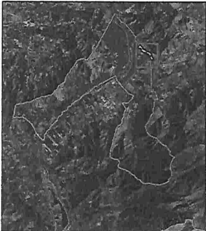
Limite Comunal, La Calera.

HUMEDAL LA CALERA, Superficie propuesta : 5,02 has.