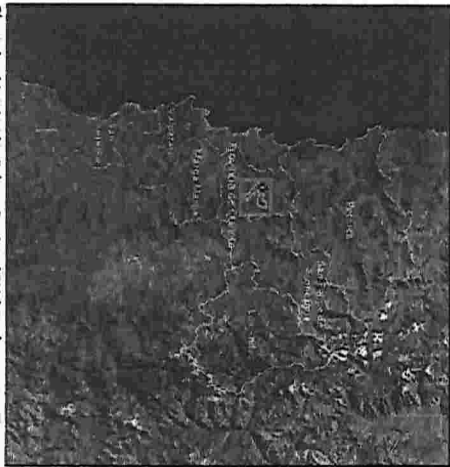
Plano de ubicación La Calera, Región de Valparaíso.