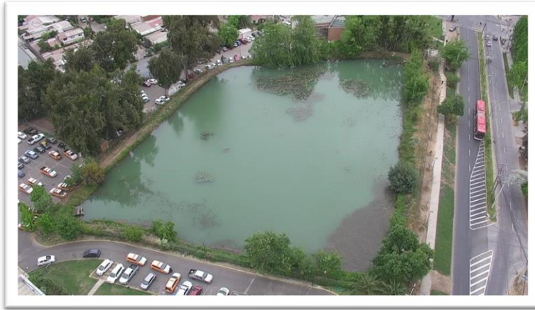
Ilustración 1 - Vista aérea Tranque Larraín

Este tranque es de origen antrópico inmerso en la ciudad, entre las calles El Rodeo y El Candil. No se cuenta con mayor información en términos de biodiversidad, sin embargo, se pueden observar variada avifauna por el lugar.