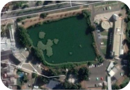
Ilustración 3 - Evolución vista aérea Embalse Larraín